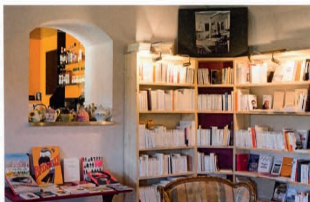
▲ En complément, on peut aussi se lover dans de grands fauteuils pour se nourrir de traités de philosophie, d'écologie...