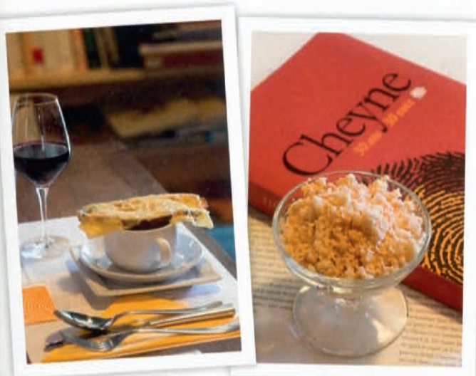
▲ La cuisine est résolument simple, de saison, à base de produits locaux, et s'accompagne de livres, évidemment!