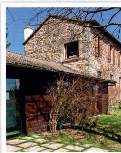
Dans le hameau de Cheyne, l'ancienne école, puis imprimerie, écrit une nouvelle page de son histoire.

plus naturelle possible. Une affaire de goûts! C'est d'ailleurs l'un des thèmes qui émaillent les 500 titres sur la cuisine et les vins. Les vins nature sont aussi un sujet de débats passionnés qui agitent autant les professionnels que les amateurs. Près du comptoir, un rayon entier propose de « Comprendre et refaire le monde ».