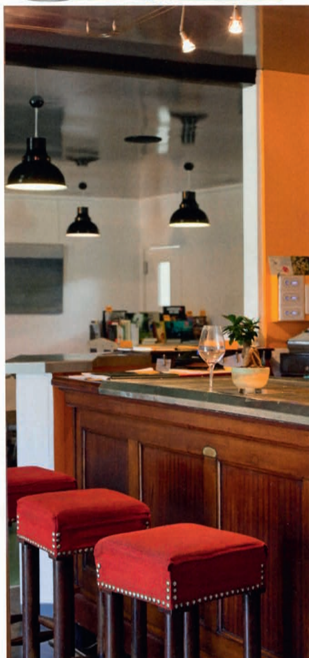
▲ En attendant le prochain débat... Sur le terrain des grandes causes, c'est en général au comptoir que tout se passe!